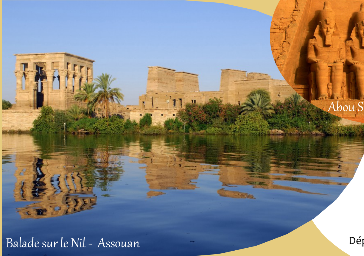
Balade sur le Nil - Assouan